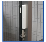
施錠確認センサー