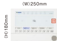
▲ 他社コントローラーサイズイメージ

コンパクト設計により、業界最小クラスのサイズを実現させました。本体カラーやデザインはインテリアのトレンドを意識したシンプルデザインとなっています。