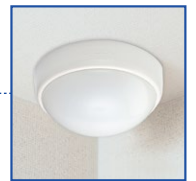
無線式空間センサー