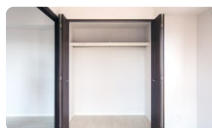
クローゼットの中でも